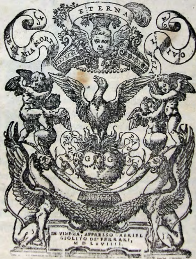
Portada i portadella