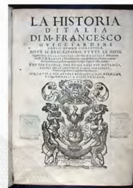
Guicciardini, 1569. B-72/4/10