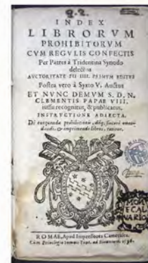
Index librorum, 1596. XVI-1980