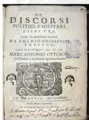
Machiavelli, 1648. XVII-L-2876