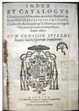
Index librorum, 1583. CM-368