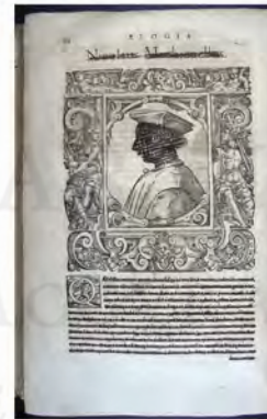
Giovo, 1596. B-27/2/5-1