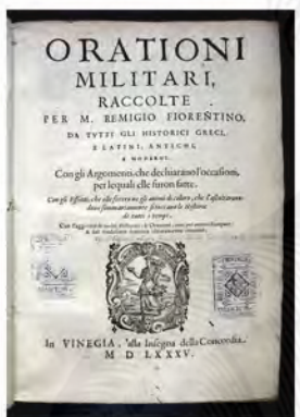
Nannini, 1585. XVI-2374