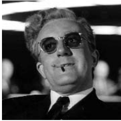
Dr. Strangelove de Stanley Kubrick