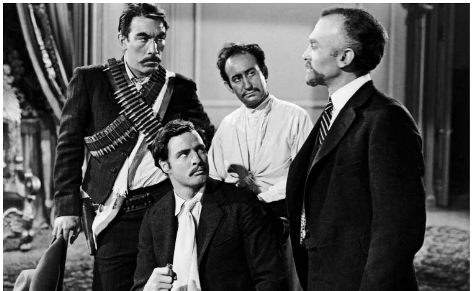
¡ Viva Zapata! d'Elia Kazan

Brando va morir el 2004, un any després de Kazan; però quinze anys els separaven. Hom ha parlat de Kazan com si fos un pare o mentor de l'actor, però més aviat va jugar el paper de germà gran. Tenien en comú un intens sentiment de revolta, un cert menyspreu pel que fa a les convencions, un llenguatge directe i sense contemplacions (d'aquí el valor dels seus elogis recíprocs), una mateixa cura del cos que els dugué a caminar per la ciutat i a practicar junts esports com ara el bàsquet; però es tractava d'una complicitat creativa que feia el lligam més fort i que, sens dubte, facilitava la pròpia experiència de Kazan com a actor als anys trenta. Per sobre de tot, Brando valorava de Kazan la llibertat que aquest donava a l'actor per tal que improvisés i construís el seu paper, per bé que ell ja en tingués sempre una idea personal quant a l'escena i el personatge. «Gairebé exigia que hom el contradigués, però no perquè hi hagués pas cap conflicte d'ego: sovint discutíem sobre la interpretació d'una escena i això sempre beneficiava el paper. Kazan tenia opinions irrevocables; no les deixava estar fins que no li demostrava que no tenia raó».