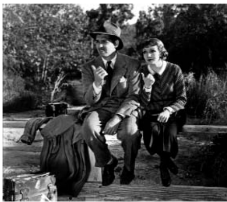
It Happened One Night de Frank Capra

Mestres clàssics com Frank Capra i Billy Wilder, amb diversos títols cadascun, són els protagonistes indiscutibles del programa. S'hi afegeixen Stanley Kubrick, amb l'única comèdia que va dirigir, Dr. Strangelove (una divertida sàtira a costa de l'holocaust nuclear); el debut en el llargmetratge de Tim Burton, Pee-wee's Big Adventure , i Mel Brooks, amb Young Frankenstein , que potser és la seva millor comèdia i un clar antecedent del cinema paròdic i brètol tant en voga en aquests darrers anys. I encara queda espai per a un parell més de comèdies modernes: la comèdia romàntica Pretty Woman , que ens permetrà inaugurar les projeccions en el sistema Blu-ray, i The War of the Roses , una comèdia negríssima dirigida per l'actor Danny DeVito. Agraïments: La Cinémathèque de Toulouse. ►