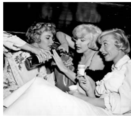
Some Like It Hot de Billy Wilder