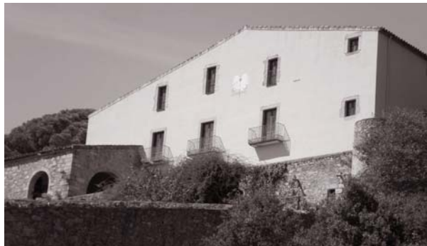
Mas Perxés (Aguilana), un dels darrers indrets en què importants personalitats republicanes es van refugiar en el seu camí a l'exili abans de creuar la frontera.