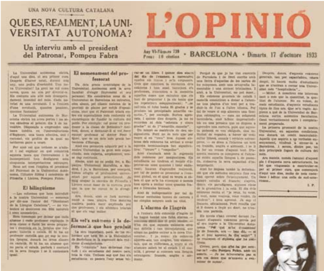
Entrevista de la periodista Irene Polo a Pompeu Fabra com a president del patronat de la Universitat de Barcelona autònoma, publicada a L'Opinió el 17 d'octubre de 1933.