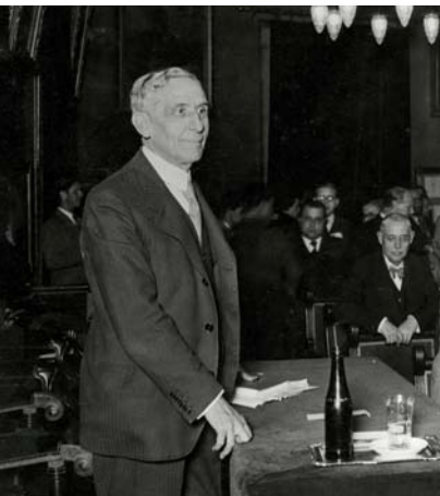
Pompeu Fabra impartint una conferència sobre la Universitat de Barcelona a l'Ateneu Barcelonès, amb motiu d'un cicle organitzat per l'Associació d'Estudiants de la Facultat de Dret, 29 de març de 1935.