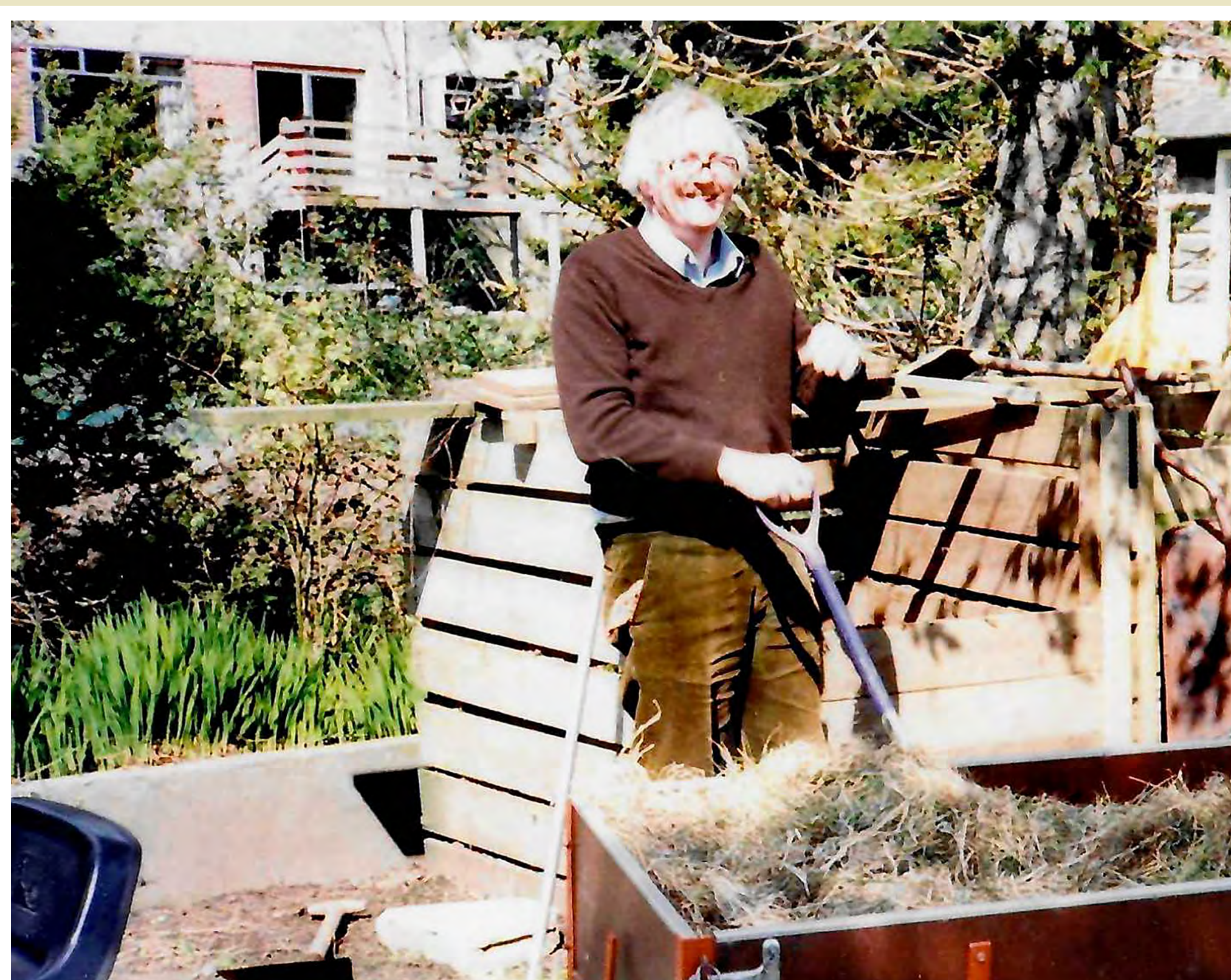
© Richard Sharpe - Fent de jardiner a Bridport, abril de 1982 / Fons Tom Sharpe