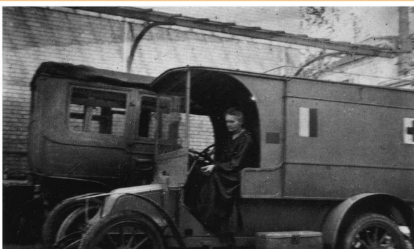
Marie conduint una de les "petites curies" el 1917.

Tots dos departaments s'edifiquen junts al carrer de Pierre Curie. L'anomenat Pavelló Pasteur es comença a construir el 1911 i s'acaba a principis de la Primera Guerra Mundial, mentre que la construcció del Pavelló Curie comença el 1912 i s'acaba el 1915, en plena guerra.