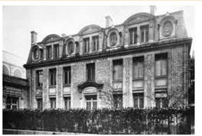
Institut del Radi a Paris