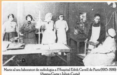
Marie al seu laboratori de radiologia a l'Hospital Edith Cavell de Paris (1915-1916)

El principal problema és la falta de tècnics en radiologia, per aquest motiu, juntament amb l'Institut del Radi i l'Hospital Edith Cavell, Marie posa en marxa una sèrie de cursos dels quals ella i la seva filla Irène formen part del professorat. Entre 1916 i 1918 formen 150 dones tècniques en radiologia que la gent coneix com manipultrices .