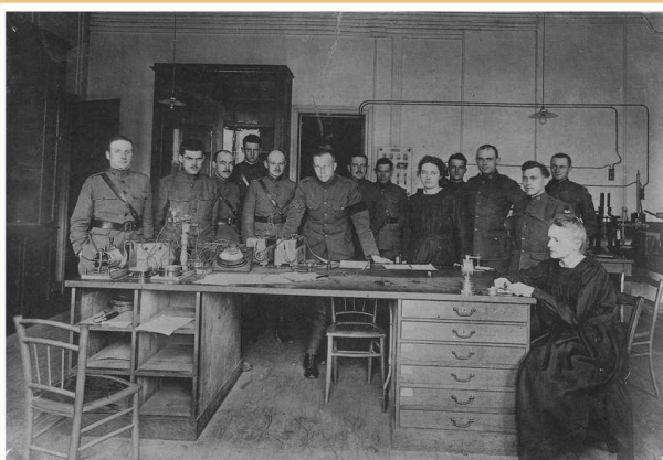
Marie i Irène amb els seus alumnes del Cos Expedicionari dels Estats Units el 1919

Tot aquest servei radiològic creat i organitzat per Marie ajuda a més d'un milió de ferits durant tota la guerra, però França no li sap agrair. Tots els seus esforços s'obliden durant la postguerra. Anys més tard ella refusa la concessió de la Legió d'Honor, tal com havia fet Pierre Curie.