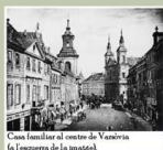
Casa familiar al centre de Varsòvia la Empressa de la març