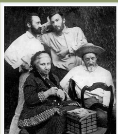
Família Curie: Pierre i Jacques amb els seus pares.

Quan Maria el coneix, Pierre, vuit anys més gran que ella, ja té notorietat dins la comunitat científica per la seva gran capacitat investigadora, així com per l'habilitat i la precisió en la manipulació d'aparells científics. Juntament amb el seu germà Jacques, havia investigat el principi d'electricitat polar, anomenada piezoelectricitat i havia desenvolupat instruments de mesura.