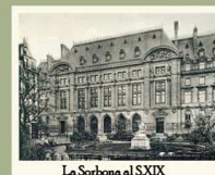
La Sorbona al SXIX