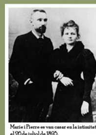
Maria i Pierre es van casar en la intimitat, el 20 de juliol de 1895.

Pierre acaba el batxillerat als setze anys i als divuit obté la llicenciatura de Física per la Universitat de la Sorbona.