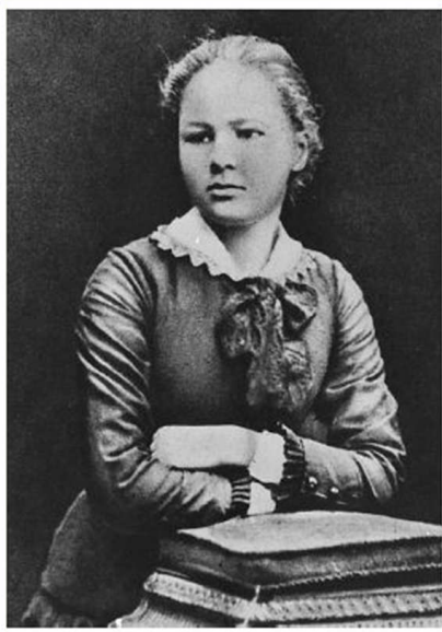
Marie Skłodowska als 16 anys.