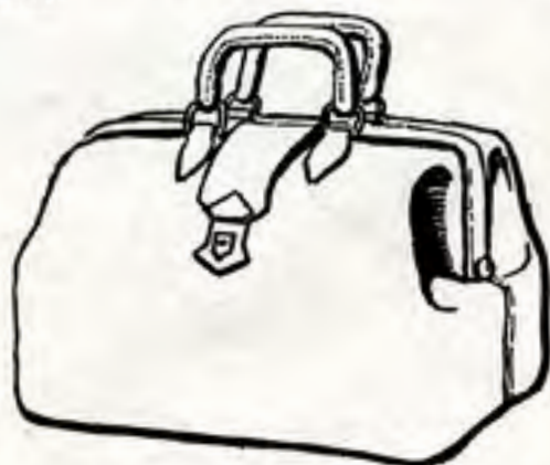
Grabado 2.—El maletín cerrado.

La división de salubridad pública del estado o del distrito podría vender a las parteras el equipo completo, o proveérselo en alguna forma. Podrían fabricarse según especificaciones para venderse por una empresa responsable en la capital de provincia, o en la población cabecera de distrito. Quizás la Cruz Roja o alguna asociación de mujeres o de costureras puedan confeccionar los uniformes, gorros de enfermera y otros artículos, para venderlos o regalarlos a la supervisora, quien los podría distribuir o vender a las parteras.