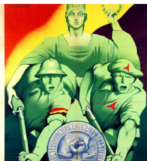
Cartells de propaganda de les Brigades Internacionals.

SÍLVIA MARIMON Barcelona ACTUALITZADA EL 28/06/2015 22:27