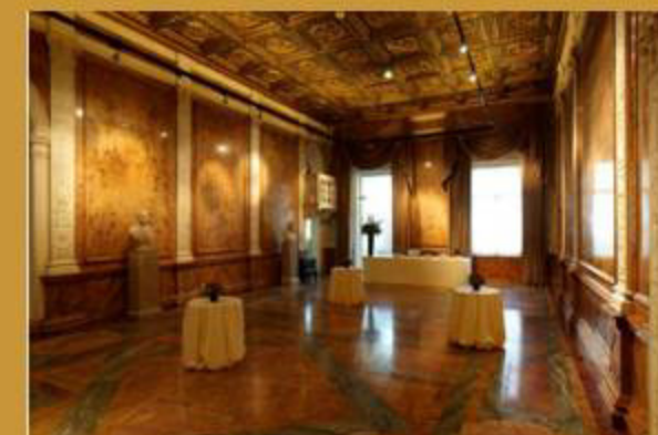
Marble Hall a Carlton House Terrace Saló per a recepcions de seminaris o conferències

Edifici, propietat de la Corona, llogat a la Royal Society. La planta baixa i el soterrani s'utilitzen per a tot tipus d'esdeveniments socials, cerimònies, publicitat etc. Al primer pis hi ha diferents instal·lacions per al personal i per als membres de la Societat. Al segon i tercer pis el president, el secretari executiu i altres membres de la Societat tenen els despatxos i els allotjaments.