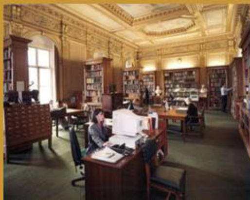
Biblioteca a Carlton House Terrace