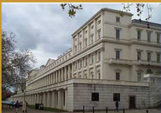
Carlton House Terrace Seu actual de la RSL