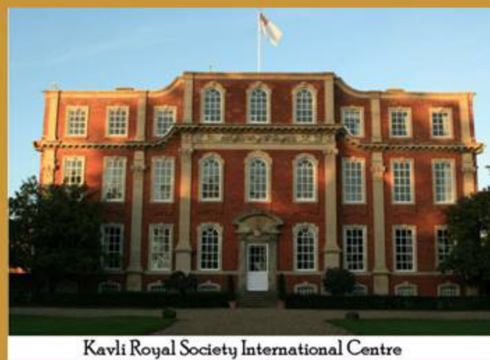
Kavli Royal Society International Centre

La Royal Society, amb el suport de la Fundació Kavli, adquireix el 2010 Chicheley Hall a Buckinghamshire. L'edifici s'anomena Kavli Royal Society International Centre, en honor a la Fundació Kavli, i es dedica a tot tipus de reunions i activitats científiques nacionals i internacionals. Aquestes activitats suposen una extensió del programa científic desenvolupat a la seu de Carlton House Terrace.