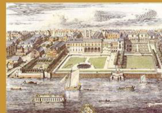
Jardins de Somerset House (Dibuix de J. Kip 1722)

El novembre de 1780, la Societat es muda a Somerset House, un edifici construït el 1776 per l'arquitecte Sir William Chambers. Comparteix l'edifici amb la Navy Board, la Royal Academy of Arts i la Society of Antiquaries. La manca d'espai per al dipòsit, convertit en una àmplia col·lecció d'espècimens d'arreu del món, fa que aquest dipòsit passi al fideïcomís del Museu Britànic i s'incorpori a les col·leccions nacionals.