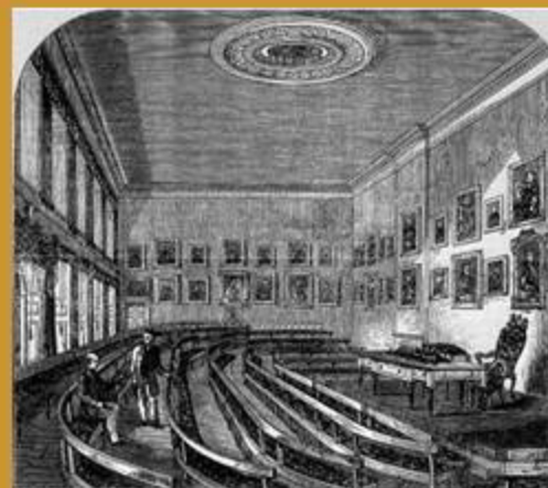
Sala de reunions a Burlington House

Durant l'ocupació de l'ala est de l'edifici, el personal d'oficina de la Royal Society passa de dues persones a gairebé vuitanta i la Biblioteca s'expandeix fins que els llibres es poden trobar pràcticament a totes les habitacions. Això provoca un nou trasllat, el 1967, a la seu actual de Carlton House Terrace.