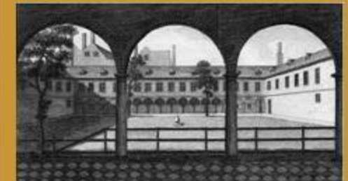
Interior de l'original Gresham College a Bishopsgate