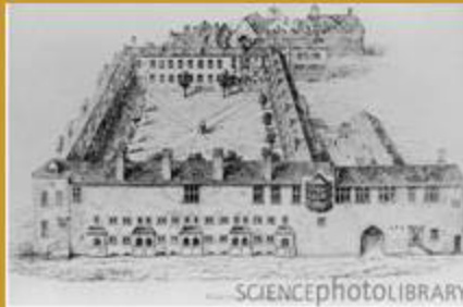
Gresham College Lloc de fundació de la RSL i de les primeres reunions setmanals dels seus membres