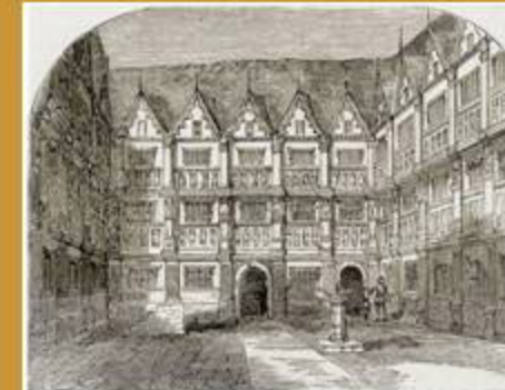
Casa de Thomas Gresham a Bishopsgate, seu del Gresham College fins al segle XVIII