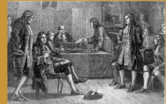
Reunió de la Royal Society a Crane Court

L'octubre de 1710, Isaac Newton, llavors president de la Royal Society, informa el Consell de l'acord de compra de Crane Court per £1,450. La Societat té per primer cop una seu pròpia, però amb menys espai del que disposava a Gresham College. A Crane Court, la Societat té una sala per a les reunions, una altra redissenyada per Christopher Wren com a dipòsit de les col·leccions, una zona de biblioteca, un jardí, una cotxera i diverses petites habitacions. Les reunions s'anuncien amb un llum a l'entrada del carrer on es troba l'edifici.