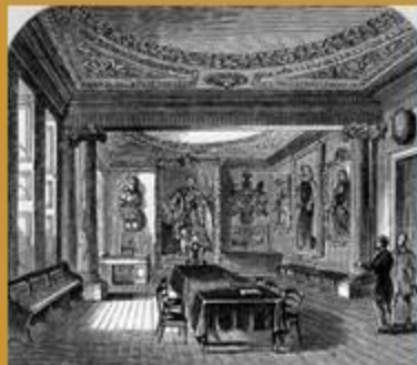
Sala de reunions a Crane Court