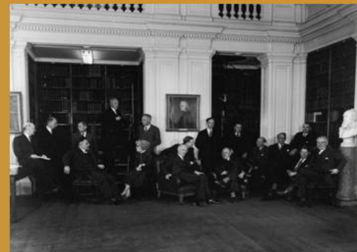
Membres del Consell de la Royal Society fotografiats a la Biblioteca de Burlington House (1960)