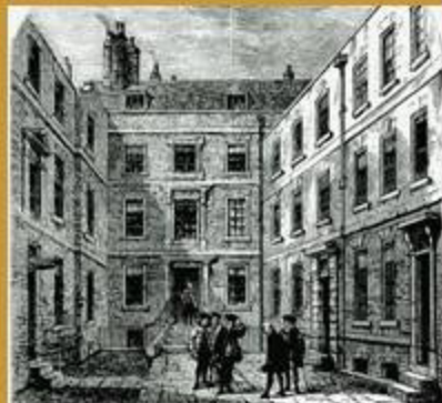
Crane Court Segona seu de la RSL proposada per Isaac Newton durant la seva presidència