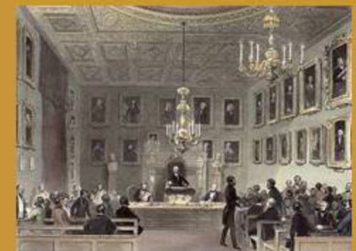
Somerset House. Tercera seu de la RSL L'edifici es comparteix amb altres institucions A la imatge una reunió de la RSL